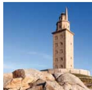
Torre de Hércules

La zona centro también guarda otros lugares interesantes, como la casa en la que vivió un joven Picasso 13 cuando se iniciaba en la pintura o los llamativos edificios construidos a principios del siglo XX bajo la influencia del modernismo 14 .