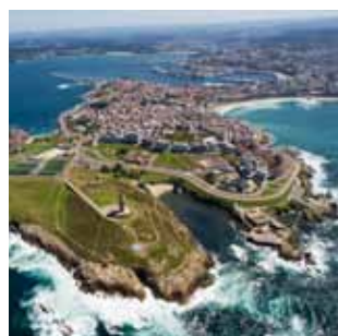
Vista aérea de la ciudad