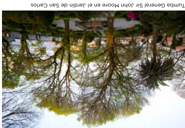
Tumba General Sir John Moore en el Jardín de San Carlos

Te brindamos nuestra mejor acogida invitándote a dar un paseo por el corazón de la ciudad: la Zona Obelisco, el Distrito Picasso y el Casco Histórico. Animadas calles comerciales, escaparates de la reconocida moda gallega y de las primeras marcas nacionales e internacionales. Tiendas de complementos, artesanía, joyería, recuerdos, anticuarios, perfumerías o decoración. Un centro comercial al aire libre en donde podrás combinar las compras con la visita a los lugares imprescindibles de la ciudad y la degustación de nuestra gastronomía en restaurantes, vinotecas, bares de tapas o cafeterías. Saborearás la vida de la ciudad con todo lujo de detalles.