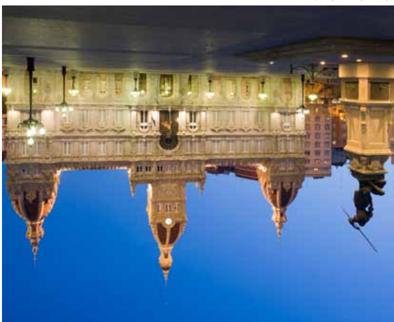
Plaza de María Pita