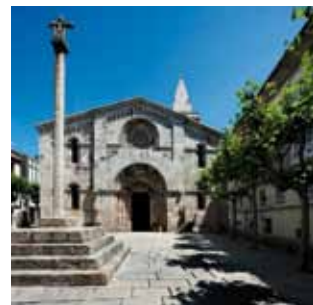
Colegiata de Santa María