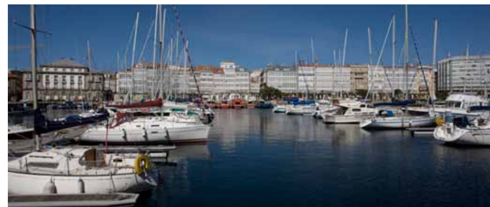
Dársena de La Marina