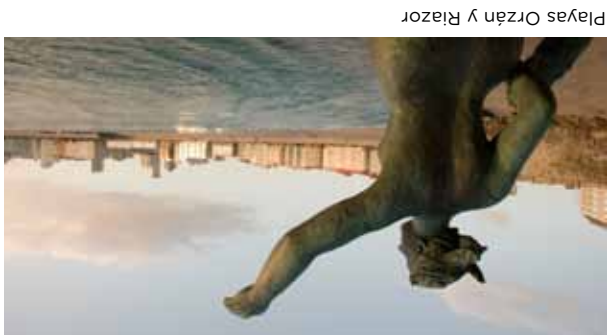
Playas Orzán y Riazor